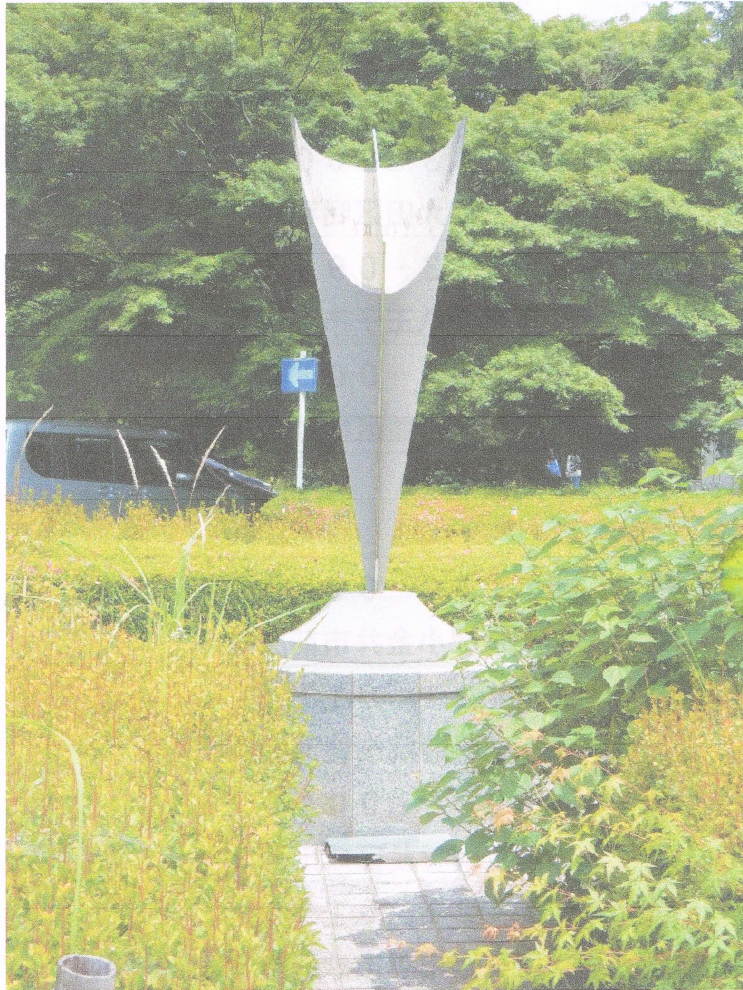
三鷹天文台 日時計