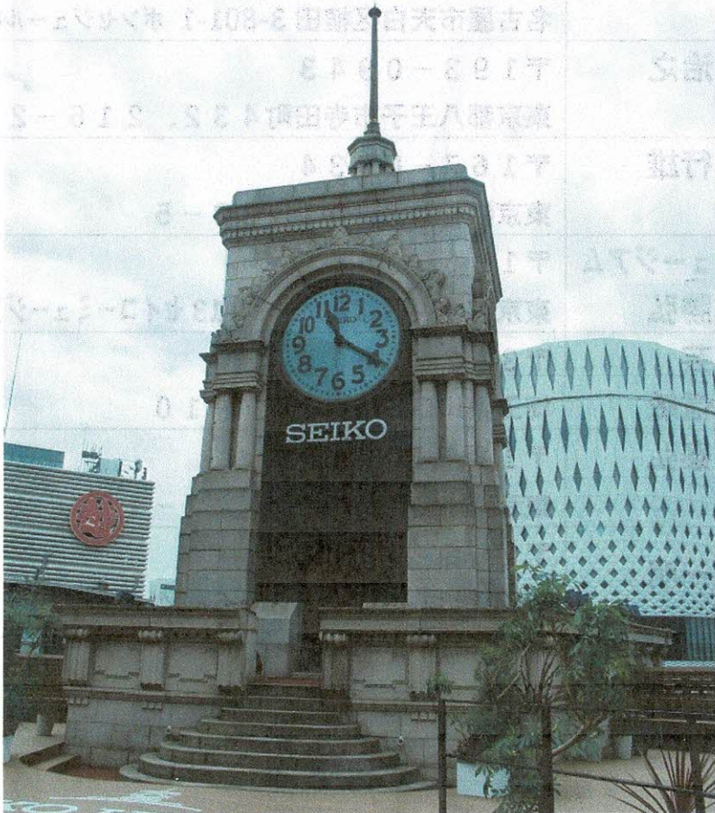
セイコーハウス銀座 屋上時計台